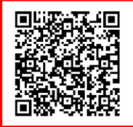
令和7年中の自転車の法令違反（自転車が第一当事者となる人身交通事故）