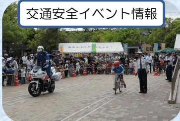
交通安全イベント情報