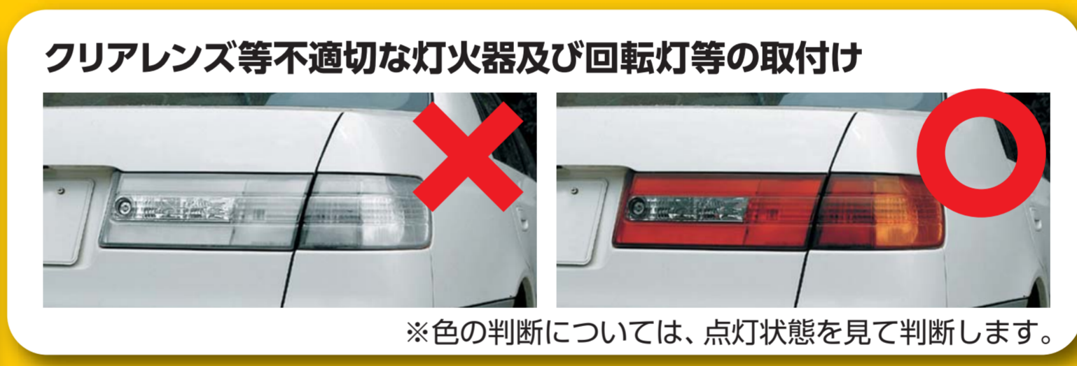
クリアレンズ等不適切な灯火器及び回転灯等の取付け