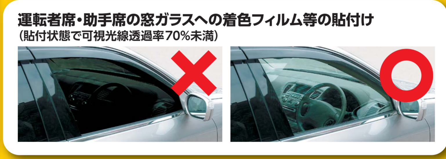
運転者席・助手席の窓ガラスへの着色フィルム等の貼付け (貼付状態で可視光線透過率70%未満)