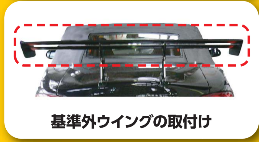
基準外ウイングの取付け