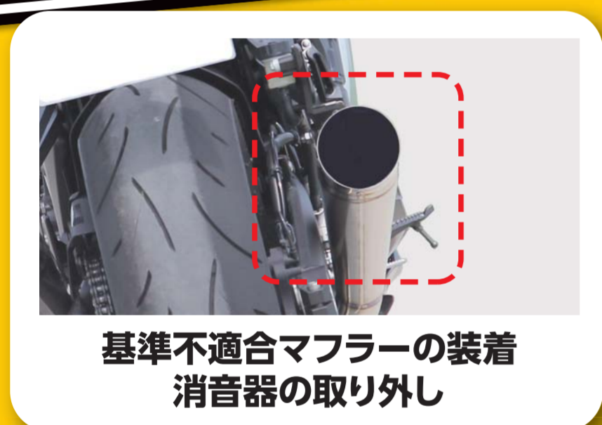
基準不適合マフラーの装着 消音器の取り外し