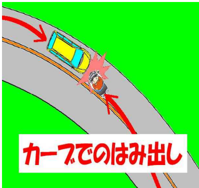
カーブではみ出し、正面衝突